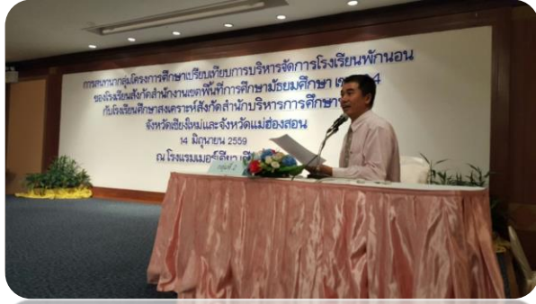
ภาคผนวก ข ภาพประกอบ